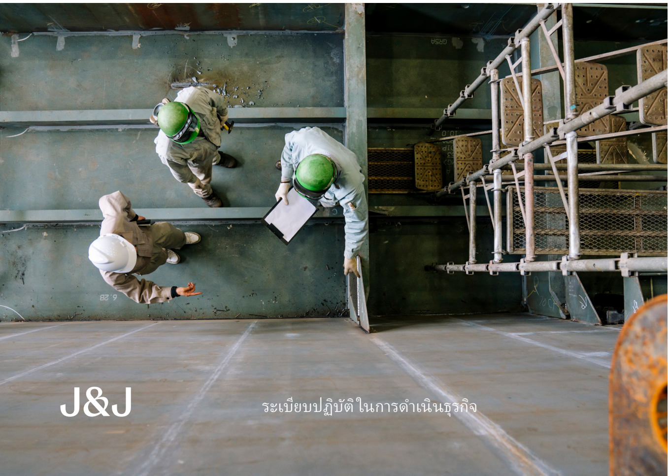
J&J ระเบียบปฏิบัติ ในการดำเนินธุรกิจ

เราทุกคนที่จอห์นสัน แอนด์ จอห์นสัน เชื่อในพลังแห่งผู้คนและให้ความสำคัญกับวัฒนธรรมที่หลากหลายเท่าเทียม และไม่แบ่งแยกทั่วโลก โดยเป็นแนวคิดที่ยังรากอยู่ในพฤติกรรมที่มีจริยธรรม ความเคารพ และคุณธรรมที่เป็นพื้นฐานของหลักความเชื่อมั่นของเรา (Our Credo) เมื่อเราปฏิบัติหน้าที่ด้วยคุณธรรมสูงสุด เราจะปฏิบัติตนอย่างสอดคล้องกับค่านิยมของหลักความเชื่อมั่นของเรา (Our Credo) และแสดงออกว่าเราใส่ใจผู้คนที่เราให้บริการและเคารพต่อผู้คนที่เราปฏิบัติงานด้วยอย่างแท้จริง พนักงานที่มีส่วนร่วมมีประสิทธิภาพ มีสุขภาพที่ดี และมีความหลากหลายนี้จะเข้าใจและก้าวข้ามความท้าทายและความต้องการที่ได้รับจากผู้ป่วย ผู้บริโภคร บุคลากรทางการแพทย์ และชุมชนได้ดียิ่งขึ้น